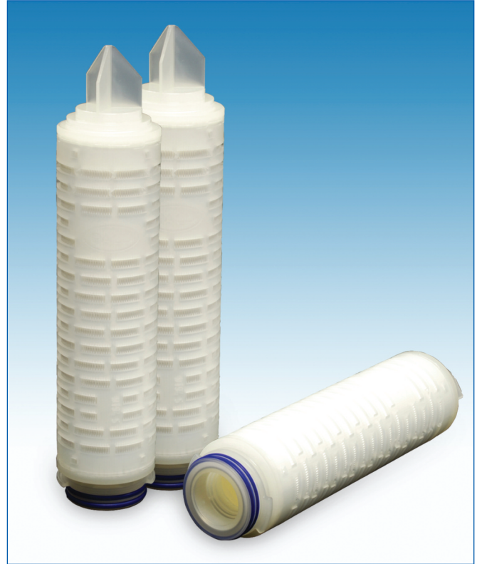
Cartouches filtrantes PREcart PP II

Les cartouches filtrantes PREcart PP II sont fréquemment utilisées pour éliminer les particules des eaux de process, du vin et des spiritueux.