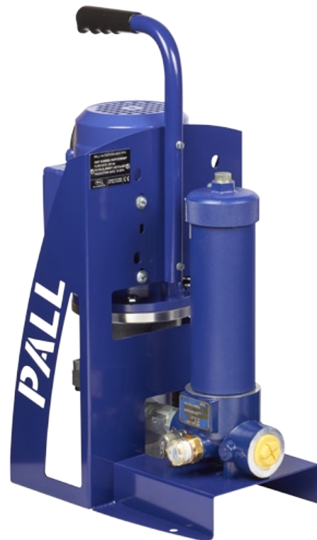
Gruppo di filtrazione Pall