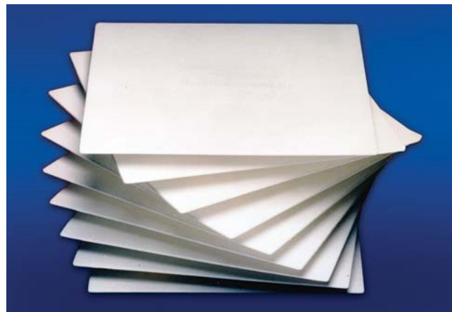
Feuilles de filtre Seitz Série K

Les feuilles de filtre K sont offertes en plusieurs grades convenant à la réduction microbienne et des applications exigeant la filtration fine, clarifiante et grossière.