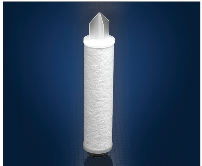
Cartouches filtrantes Nexis T