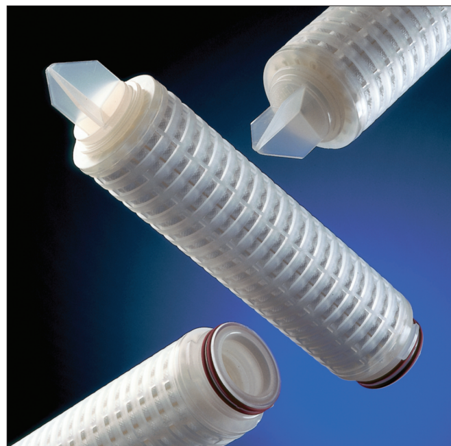
Cartouches filtrantes Profile Star

Vous trouverez sur le site Internet de Pall http://www.pall.com/foodandbev une déclaration de conformité aux exigences de la législation nationale et/ou des réglementations régionales concernant l'utilisation au contact des aliments.